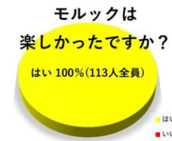
玉川校区体育振興会