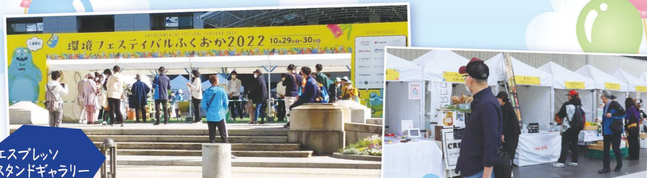
エスプレッソ スタンドギャラリー TAGSTA様

環境フェスティバルふくおか2022では、出店者の方が 食物の皮や芯などの食品廃材でできたお皿や お米でできたストローを使用しました。