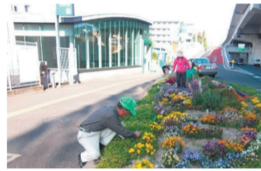
花壇を整備する同クラブの皆さん

●活動を始めたきっかけ 平成17年の七隈線開業前、梅林駅周辺は道路沿いに花壇があったものの、整備が行き届いておらず、雑草だらけの見栄えが悪い状態でした。駅周辺を通る人が明るい気持ちになるような場にしたと、町内会で協力を呼び掛け、役員を中心に七隈線開業に合わせて花づくり活動を始めました。