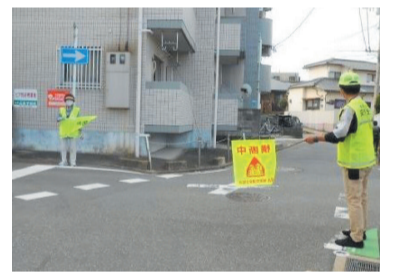
下校する子どもたちの見守り活動

区内を通る地下鉄七隈線が、3月27日(月)に博多駅まで延伸します。駅周辺で活動する団体や地域の人から、沿線のにぎわいやまちのさらなる活性化に向けて、期待の声が聞かれています。