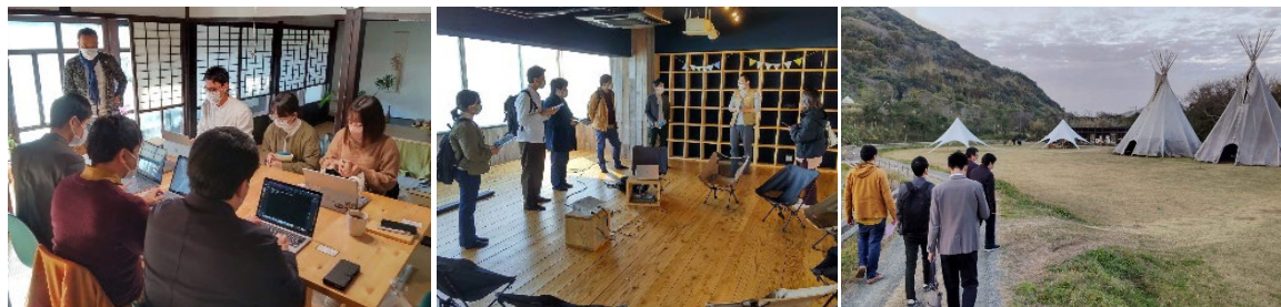
<学生によるプログラム開発の様子>