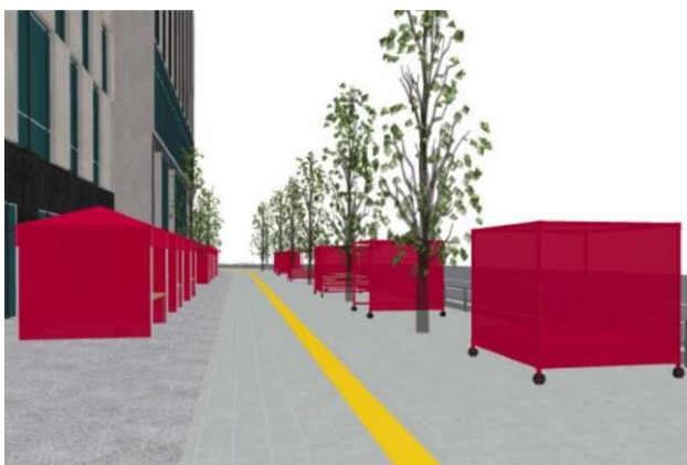
(歩道から見たイメージ)