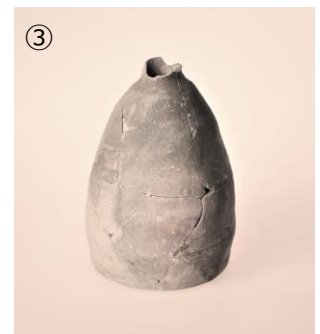
③ 朝鮮半島系土器 (液体運搬具?)

遺跡で最も多く出土するのが土器。遺跡の年代を推定する基準にもなる重要な遺物です。「でも、土器なんか見て何が楽しいの?」そんな声にお応えして、土器鑑賞がちょっと楽しくなる「どきどきポイント」を紹介します。