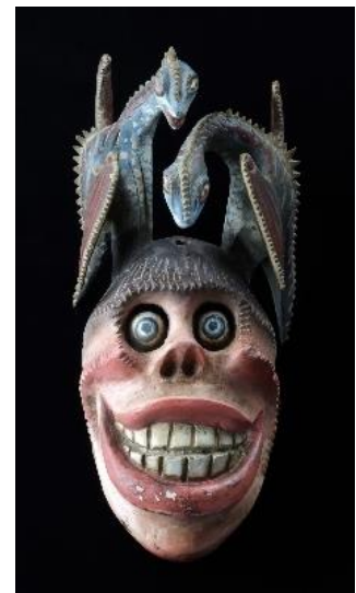
悪魔仮面（メキシコ） 国立民族学博物館所蔵

世界の人々は常識や慣習から逸脱した「異」なるものを、どのように認識し、説明し、描いてきたのでしょうか。本展は、人魚や龍、河童など、想像界の生きものの多様性について絵画や書籍、祭具などをおして紹介し、人間の想像と創造の力の源泉を探ります。詳細は、別紙チラシをご覧ください。