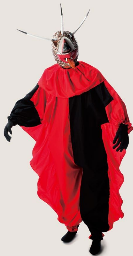
人のようでない、有角人

世界の人々は常識や慣習から逸脱した「異」なるものを、どのように認識し、説明し、描いてきたのでしょうか。本展は、人魚や龍、河童など、想像界の生きもの多様性について、絵画や書籍、祭具などをとおして紹介し、人間の想像と創造の力の源泉を探ります。奇妙で怪しい、不気味だけどかわいい、世界の霊獣・幻獣・怪獣が大集合！