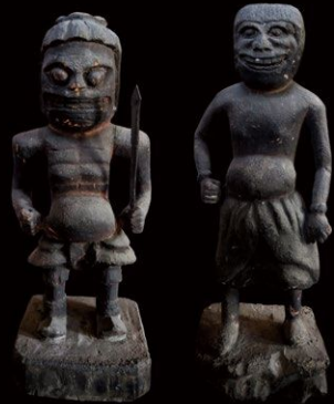
初公開 水辺の守り神