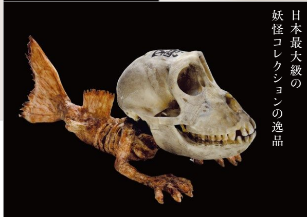
日本最大級の 妖怪コレクションの逸品