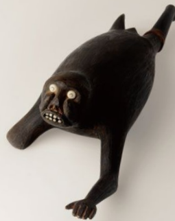
境界を行き来する、変身獣