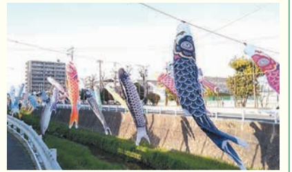
川に泳ぐこいのぼり(飯原)

開 = 日時 所 = 場所 問 = 問い合わせ ☎ = 電話 ㊟ = ファクス 対 = 対象 定 = 定員 料 = 料金、費用 持 = 持参 託 = 託児 申 = 申し込み 電 = メール 開 = 開館時間 休 = 休館日