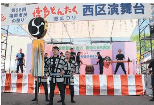
令和元年の西区演舞台

西区では、4年ぶりに区役所駐車場に「西区 演舞台」が設置されます。合計35団体による ダンス、演奏、コーラスなどが披露される他、 飲食の出店や、さまざまな景品が当たる抽選 会(要引換券)もあります。