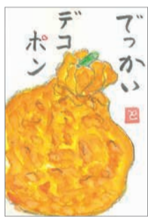
絵手紙 西区 70代

スコア180を目指して、再開したボウリング。先週174が出ました。もう一歩です。練習はまだ足りませんが、夏までには達成して、次は夢のスコア200を目標にしたいものです。