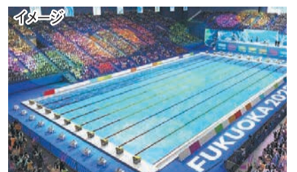
マリンメッセ福岡A館会場のメインプール

7月14日(金)に開幕する世界水泳選手権2023福岡大会の「親子バックヤードツアー」を開催します。プールサイドなど、普段は入れない選手エリアを見学できる貴重な機会です。また、参加者には同日の競技が観戦できるチケットをプレゼントします。