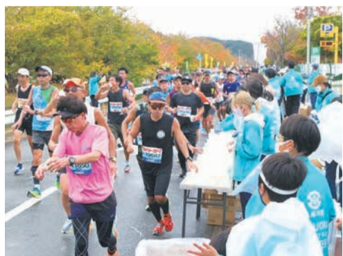
給水所でランナーに水を渡すボランティア

マラソン大会は、大会3日前から当日まで、多くのボランティアの皆さんによって支えられています。節目となる10回大会を一緒に盛り上げませんか。 ●活動日 11月9日(木)～12日(日) ※活動日は選択可