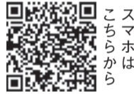
スマホはこちらから