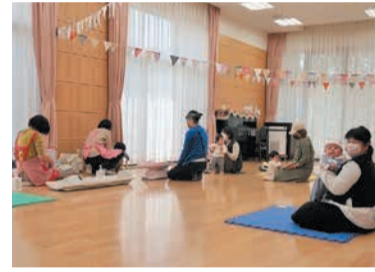
身体測定時は助産師などがサポート