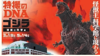
TM & © TOHO CO., LTD. ©特撮のDNA製作委員会

〒810-8622 中央区大名二丁目5-31 区役所代表電話 ☎714-2131