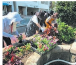
花の手入れを学びます

中央市民センターの花壇を管理するボランティアを養成します。期5月31日(水)午前10時～正午(小雨決行。大雨時は講座のみ実施し、実技は6月7日(水)に延期)所同センター2階実習室区内ボランティア活動に参加できる人先着10人料無料申電話、はがき、ファクス、来館で4月15日(土)から同センター(〒810-0042赤坂二丁目5-8 ☎714-5521 ☎714-5502)へ。