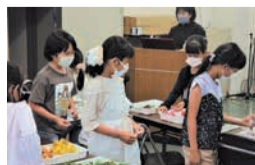
過去のワークショップ

座学やワークショップで植物の色について学びます。開6月4日(日)午後1時半～3時半開小学生開20人(抽選)開500円開往復はがきかファクスに応募事項とファクスの場合はファクス番号も書いて、5月21日(必着)までに同園へ。ホームページでも受け付けます。