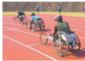
詳しくは大会ホームページでご確認ください(募集要項の配布はありません)。

障がいのある人が大会にチャレンジしやすいよう、競技用車いすの貸し出しや練習会、写真などをを行います。また、伴走者の紹介や伴走者向け研修会も実施します。