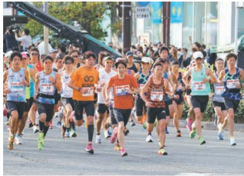
天神からフルマラソンは糸島まで、車いすとファンランは早良区百道まで走ります

今年、「一般枠」のほか、福岡・糸島の両市民を対象とした「市民枠」抽選3000人▽福岡市または糸島市に10万円以上の