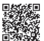
「友だち追加」 はこちらから

「福岡市LINE(ライン)公式アカウント」を「友だち追加」すると、「生活情報一覧」から制度や手続きなどの情報をチャット(対話)形式で確認できます。問い合わせは、税制課(☎711-4202 ☎733-5598)へ。