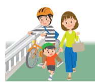
歩道では歩行者を優先