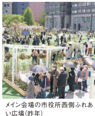
メイン会場の市役所西側ふれあい広場(昨年)

メイン会場の市役所西側ふれあい広場が、企業や学生たちによって制作された花壇や花装飾で彩られます。また、併せて市民