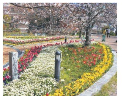
各公園や広場等の花壇で、鮮やかな春の花が楽しめます(写真は昨年の清流公園)