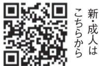
新成人は こちらから

右コードの専用フォームか、ホームページ(「福岡市歯科医師会」で検索)から、4月28日(金)までに申し込みを。※高齢者部門は、はがきでの申し込みも可能です。はがきに住所・氏名(ふりがな)・年齢・生年月日・電話番号を記入の上、4月28日(必着)までに福岡市歯科医師会内「健口コンクール」係(〒810-0041中央区大名1-12-43)へ。