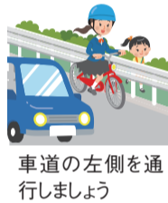
車道の左側を通行しましょう