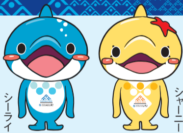
福岡大名ガーデンシティ(中央区大名二丁目 大名小学校跡地)