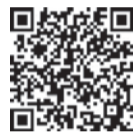
「友だち追加」はこちらから

また、市に多く寄せられる質問やごみの分別方法などについて、チャット(対話)形式でいつでも簡単に確認できます。便利な「福岡市LINE公式アカウント」をぜひご利用ください。