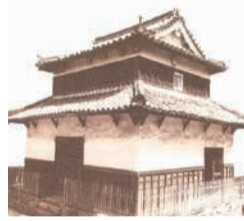
城外に移築されていた潮見櫓

寄付金は、「ふるさと納税」として扱われ、税の控除が受けられます。また、1万円以上寄付した人のうち希望者の芳名板を城内の三の丸スクエアに掲示します。詳細は市ホームページ(「福岡城 基金」で検索)をご覧ください。☎市史跡整備活用課 ☎711-4784 ☎733-5537