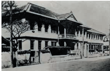
明治27年から使われた市役所(2代目)

大正12(1923)年に3代目の庁舎が現在地に建設され、昭和の戦争期を含む62年間にわたり使用されました。