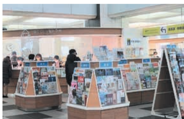
年間約4000種類の資料を備えています

大正12(1923)年に3代目の庁舎が現在地に建設され、昭和の戦争期を含む62年間にわたり使用されました。