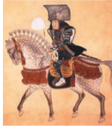
上:黒田如水像、下:黒田長政像(いずれも市博物館蔵)

幕府に遠慮して天守を造らなかつたともいわれていますが、近年、細川家の手紙に「長政が天守を取り壊すらしい」との記述があったことが分かります。天守は存在したのではないかとの説もあります。