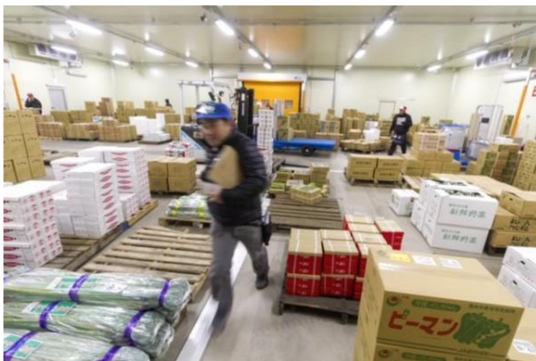
低温卸売場内の様子

ベジフルスタジアムの低温卸売場を15℃±3℃で温度管理、市場内での物流時間を管理（低温卸売場内への速やかな搬入）などの高度な品質管理体制が評価され、 全国で初めてのJAS認証取得 となりました