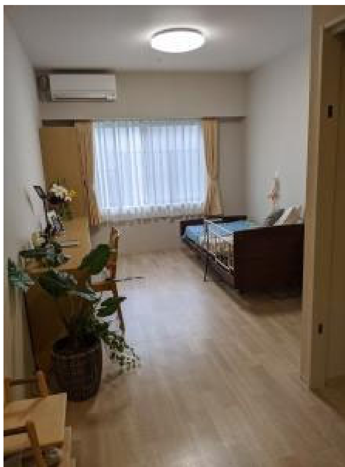
モデルルーム（介護専用居室）

3Fには、共用施設としてレストランやブックコーナーのほか多目的ホールやAVルームが設けられていて、サンカルナ入居者だけでなく センターマークス街区 にお住まいの方も利用することができます。