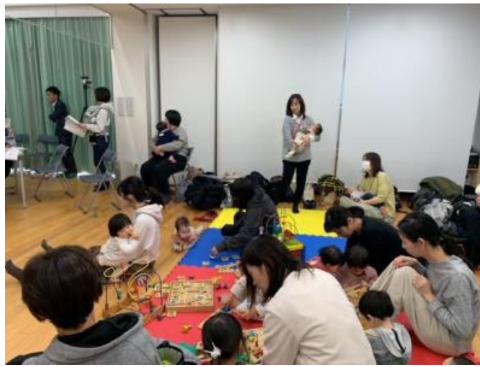
小さい子は後ろで遊ばせながら聞くことができるよう配慮されていました

アレルギーについて情報を知りたい方に、こちらのサイトの紹介がありました。参加できなかった方は参考にされてみてはいかがでしょうか。