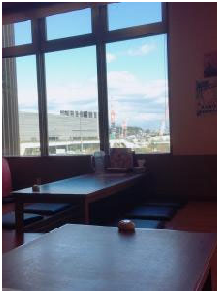
掘りごたつ席やテーブル席など180席（車いすで入店可）。

博多、中洲川端に店舗展開する御膳屋グループのひとつ、「御膳屋 照葉スパリゾート店」には、平日限定20食の「照葉膳」をはじめ、定食も一品料理も風呂あがりのビールもおつまみもデザートも盛りだくさん。