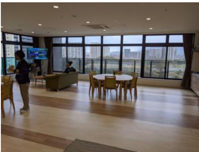
4階デイコーナーから公園が見える