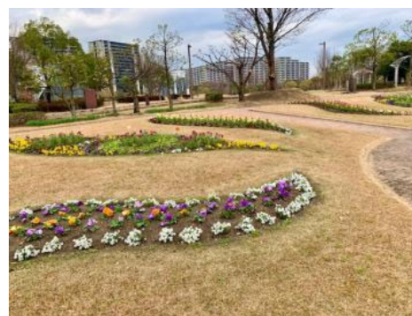
花壇の配置も何かを表しているそうです…全体はぜひ現地でご覧ください

グリーンナリー花壇は年に4回程度、花の植替えが行われており、1年中楽しめるよう整備されています。