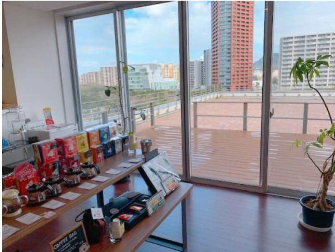
ビルの最上階からの眺めは抜群！ 外にはテラスが。

切実にカフェを望んでいた住民に、やすらぎと交流の場を提供しながら、日々発展するアイランドシティの街並みを人々とともに見守ってきました。