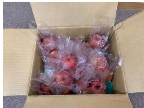
おみやげにりんご

・アイランドシティってどんなところ ・ぐりんぐりんはおもしろい建物 ・コンテナターミナルで何をしている？ ・野菜や果物はお店に並ぶ前はどこからきている などを一緒に学びました。