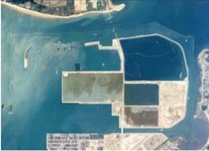
1999年ごろのアイランドシティ

「この一年の間にも、新しい住宅・マンションや、商業施設・宿泊施設の建設が進むなど新鮮さを常に感じています。」