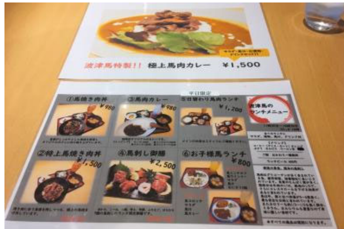
馬肉づくしのランチは馬焼き肉丼など980円から。この日の日替わり（1200円）は、馬のメンチカツ、馬コロッケ、馬ウィンナー、馬汁、ごはん、サラダ。ランチはすべてドリンク付きです。

馬刺しのみならず、馬肉の塩焼きやすじ煮込み、馬寿司、さくら鍋などの馬肉料理のほか、豊富な焼酎とともに、からし蓮根ややまうに豆腐といった熊本の郷土料理も。