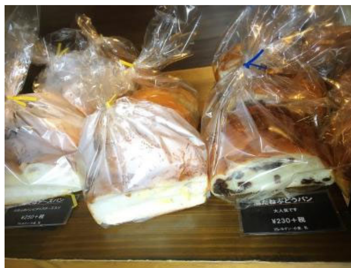
ほかほかの湯だめチーズパン&湯だねぶどうパン

また、人気の「5丁目ドッグ」（Mサイズ320円）は、自慢のフランスパンにチョリソー、キャベツを挟んでチーズをトッピング。