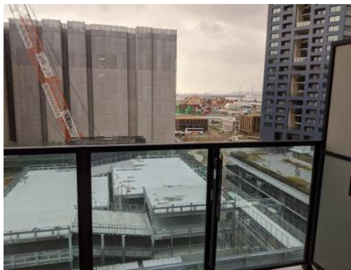
ベランダ(モデルルーム602号室)からセンターマークスタワーとバス営業所が見える