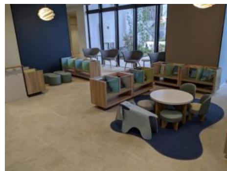
子どもと一緒に楽しめます