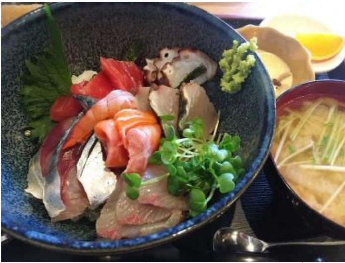
ヒラス、サワラ、エビ、マグロ、サバ、サーモン、タコ等がずらりと盛り付けられた海鮮丼（1200円）は、すべてぶりぶりと新鮮そのもの。