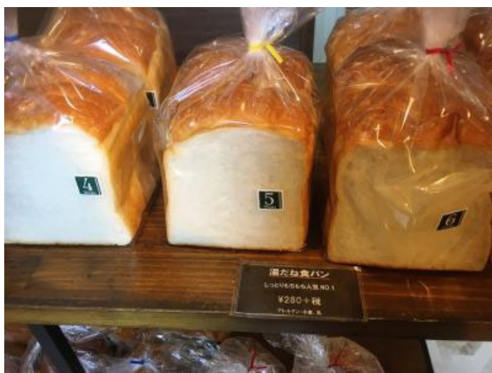
4枚切り、5枚切り、6枚切り、お好みで。

頬張るとパン自体のやわらかな甘みとともに、ごろごろ具材の食感も楽しめます。ワインにもあいそう！