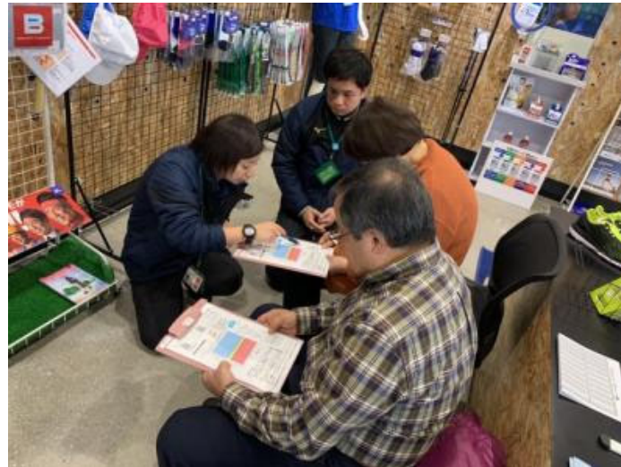
アドバイスをもらえます

すぐに測定結果がでて、 トレーナーさんから結果の説明と、アドバイスをもらえます。