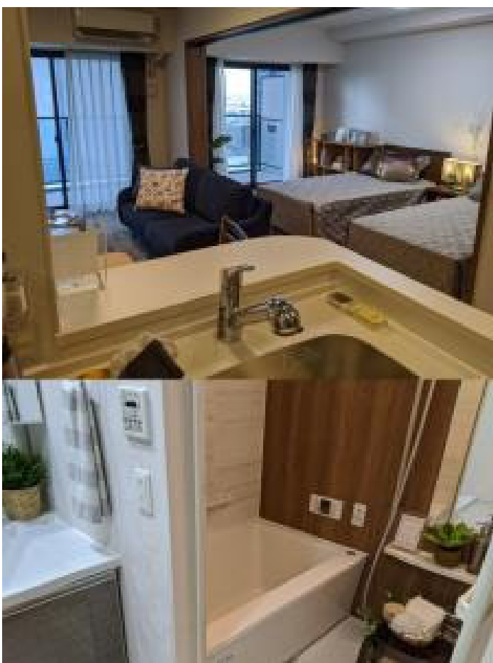
モデルルーム（一般居室）