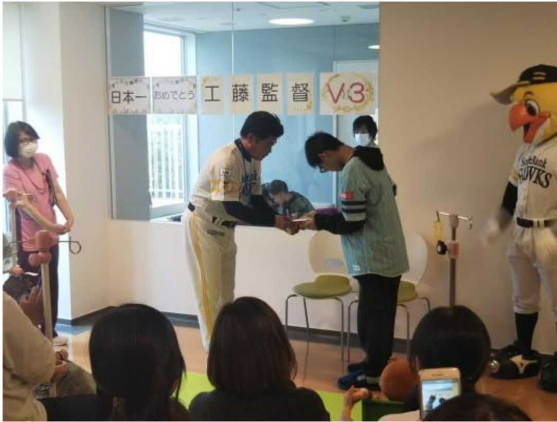
こども達からメッセージカードを贈呈