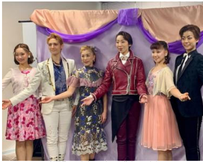
劇団員のみなさん、とても華やかです！

商業施設にはisland eyeにしかないテナントや、九州初出店のテナントもたくさんあり、「食」や「遊び」を楽しめる空間となっているそうです。