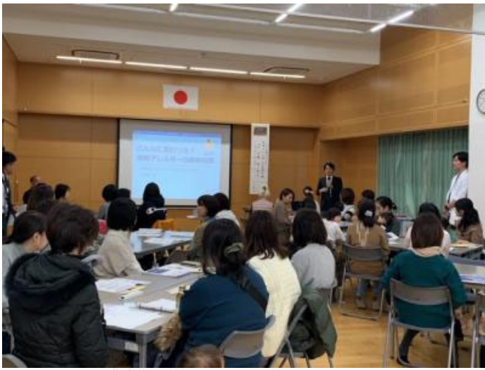
講演後は質問もたくさん挙がっていました