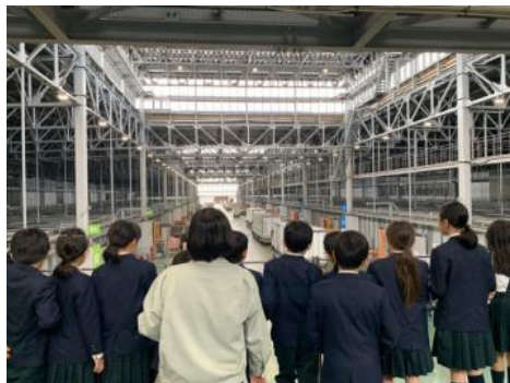
先日JAS認証をとったベジフルスタジアムの低温施設を外側から