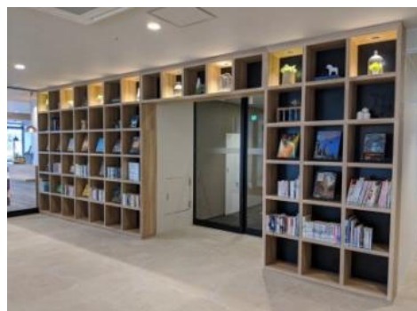
年に2、3回本の入れ替えがあるそうです