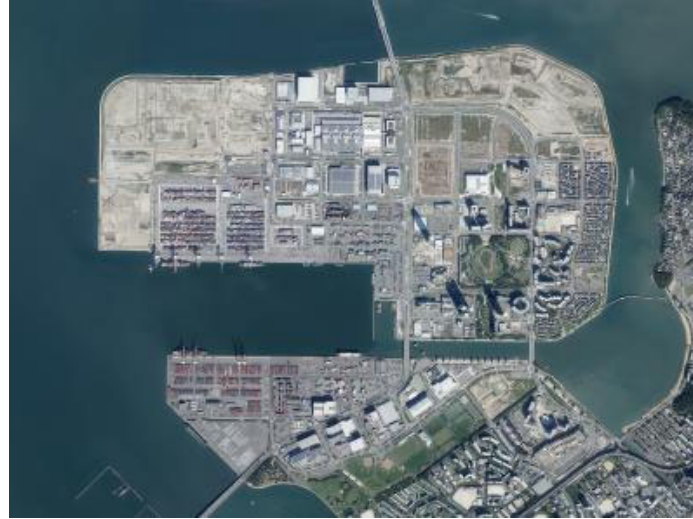
2018年のアイランドシティ

アイランドシティでお仕事をするようになって、1年とのことですがアイランドシティのいいところ、好きなところってどんなところですか？