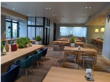
取材当日のメインは鯛のムニエルでした

レストラン入口近くのブックコーナーでは、隣の賃貸マンション（ラクレイス香椎照葉）とつながるコミュニティ広場を眺めながら読書が楽しめそうです！