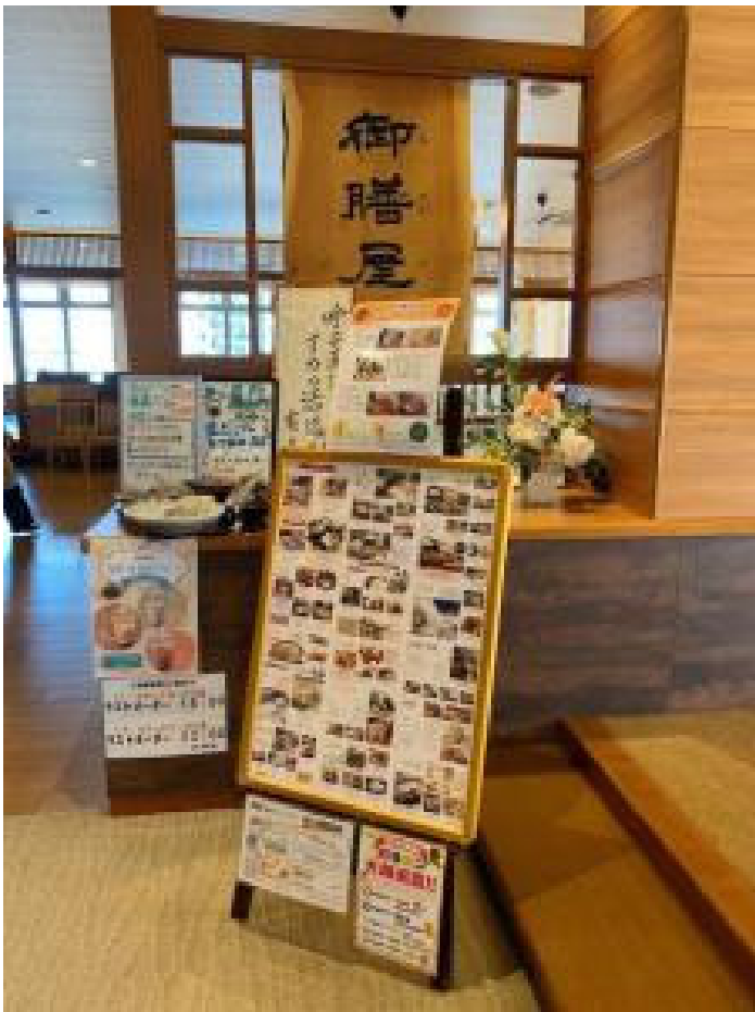
呼子直送！イカの活造りもあります。