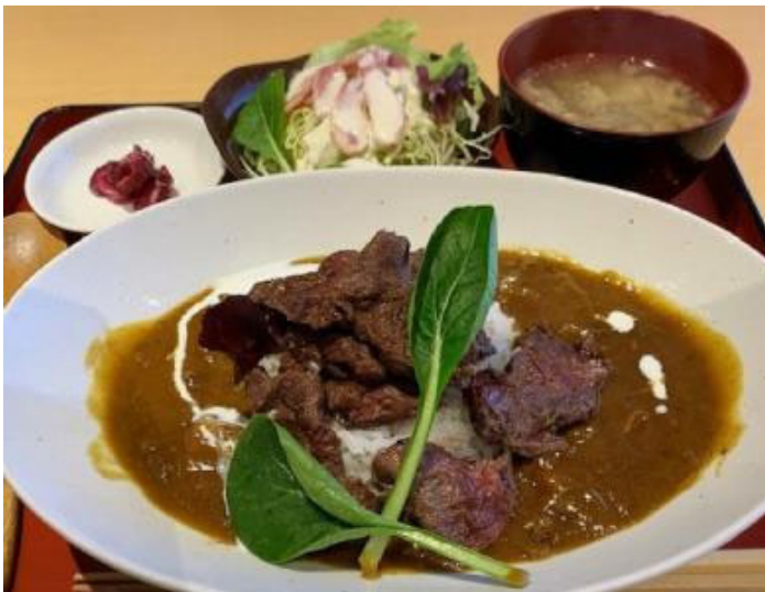
ランチの極上馬肉カレー。サラダの上には噛むほどうま味の出るふたえごの燻製が乗っています。

とっておきの新鮮な肥後馬刺しの夜メニューは、なかなか食べられないようなありとあらゆる部位が用意されており、なかには「舌」なんて幻の一品まで！