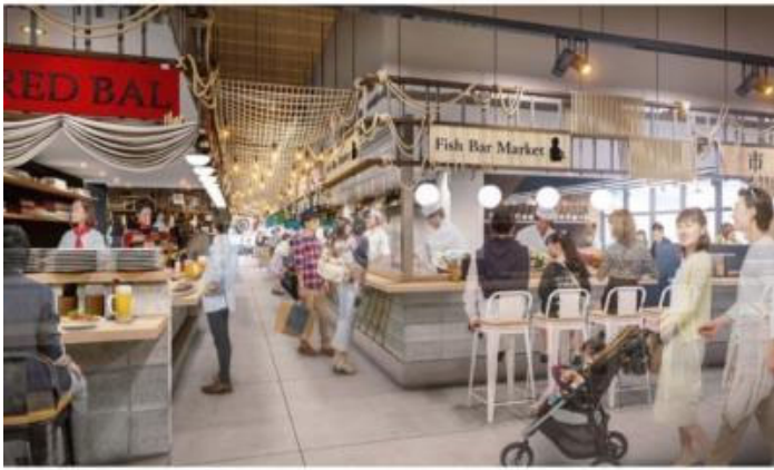
商業施設イメージ

会見では、「地域の方にも、福岡や九州のほかの地域や外国から来られる国内外の観光客の方にも楽しんでもらえる施設を目指したい」とのお話がありました。