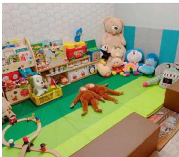
珈琲を飲むあいだに子どもも遊べるキッズスペースもうれしい。