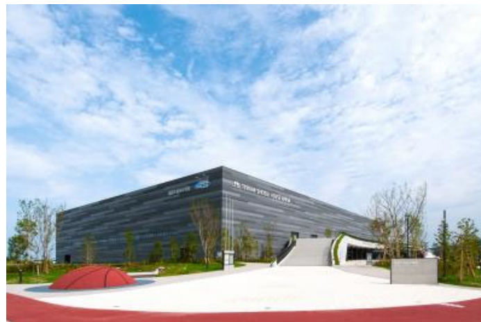
開館して1年3か月の新しい施設です

アイランドシティの大きな魅力の1つである総合体育館の今後の取り組み、とっても楽しみです！