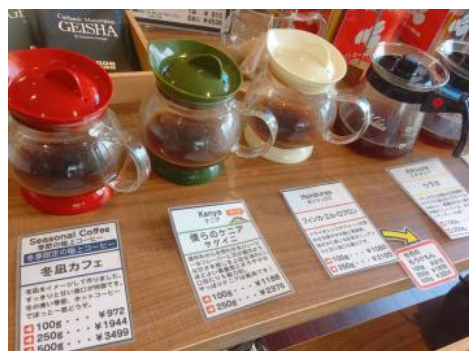
販売している豆はすべて試飲ができます。お気に入りの一杯を見つけましょう！