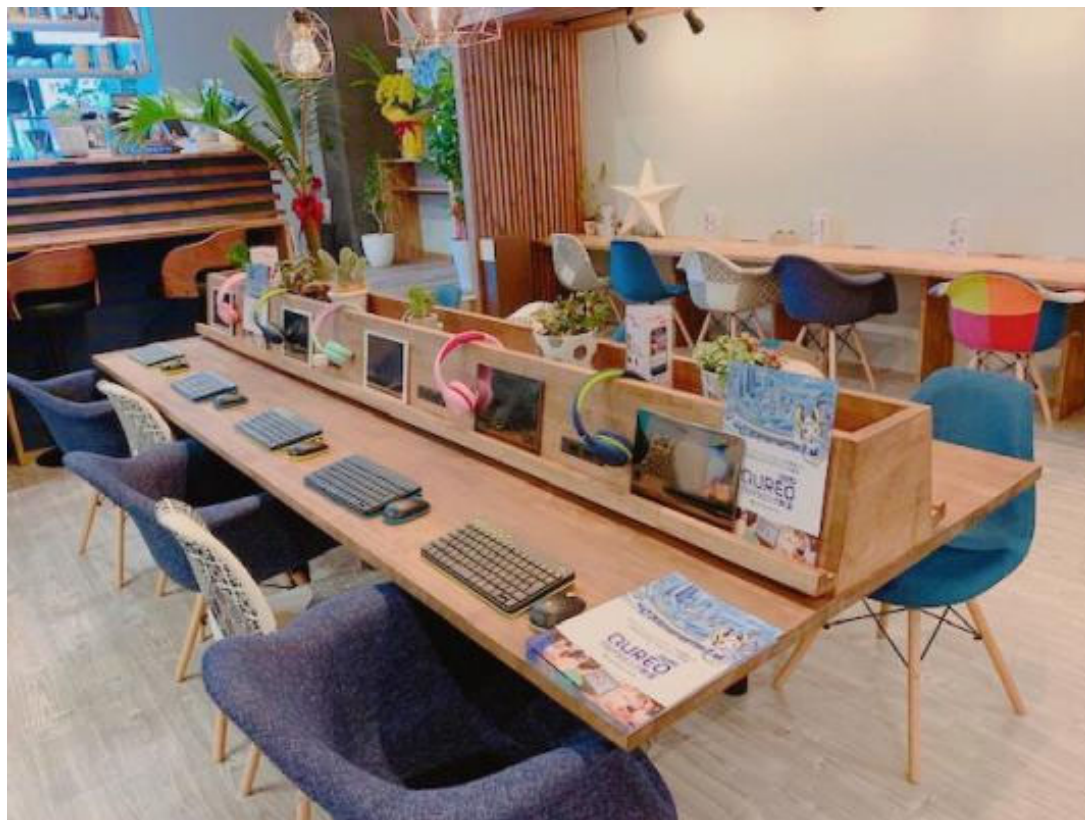
よく見ると、子どもの身長にあわせた机と椅子が並んだ一角。キーボードやタブレットもキッズサイズ！

2020年最初にオープンしたのは・・・プログラミングカフェ「Happily」です。