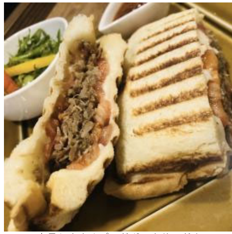
店長おすすめブルドボークサンド！