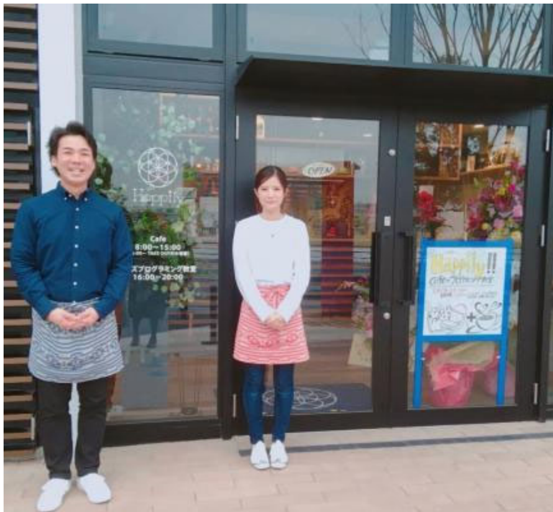
おもわず覗き込みたくなるお店のまえて。『お待ちしております！』