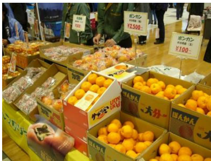
新鮮な野菜、果物がお得！