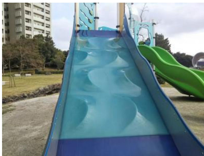
ドコドコなすべり心地