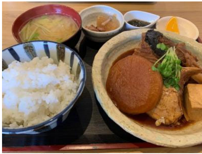
本日の日替わり（950円）はブリカマの煮つけ。大ボリューム！