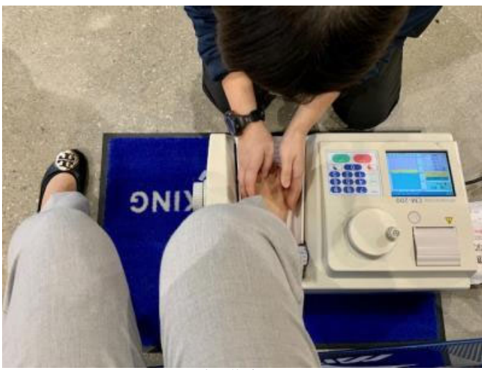
記者も体験・・・