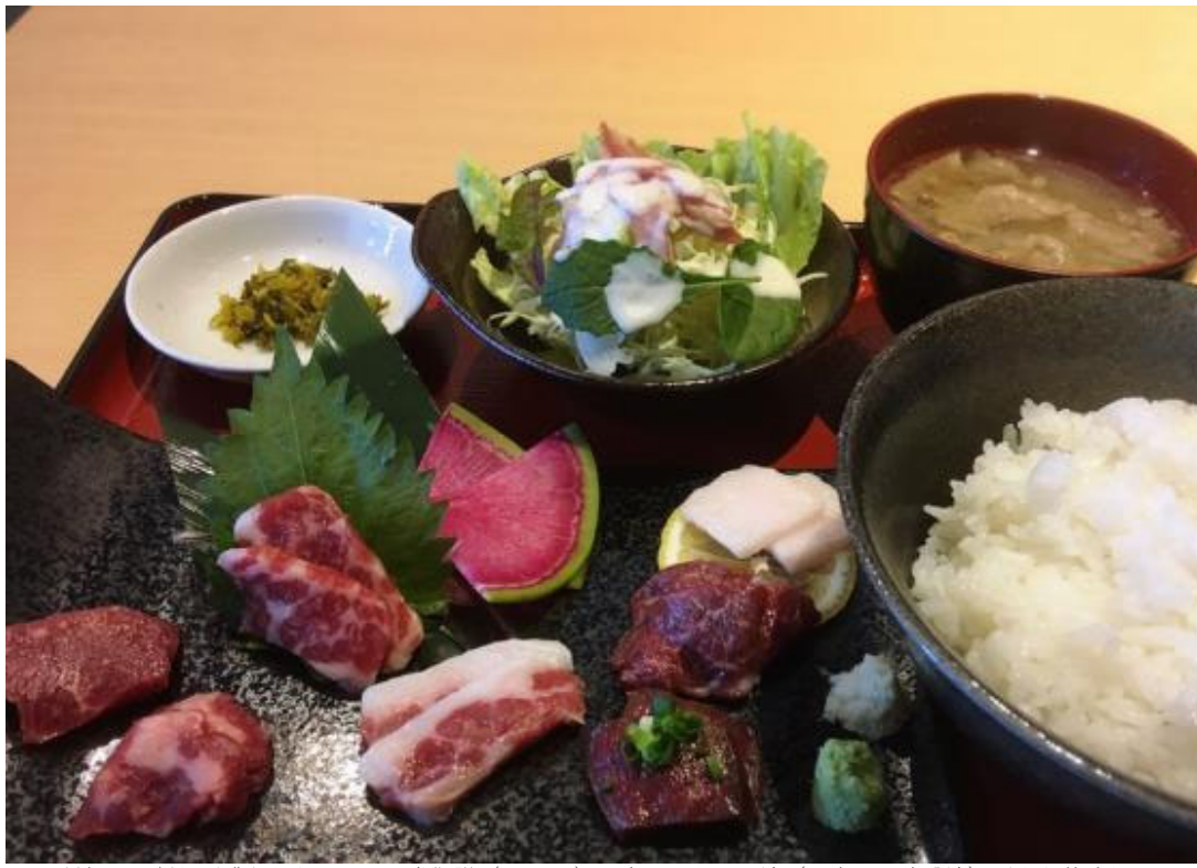
7種類の馬刺しが盛られたランチ限定御膳（2500円）。奥に見える馬汁（馬肉のお味噌汁）がまた美味しい！