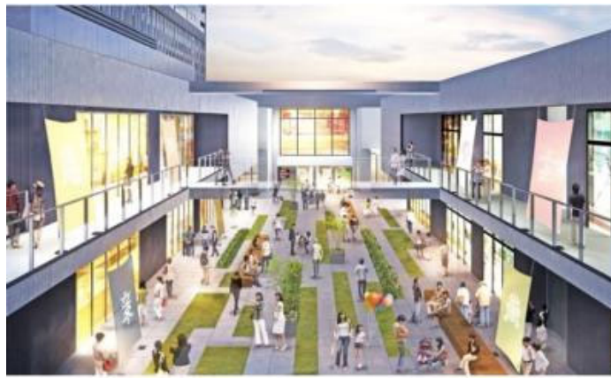
商業施設イメージ

グランドオープンまであと2か月、アイランドシティがさらに活気あふれるまちになります。