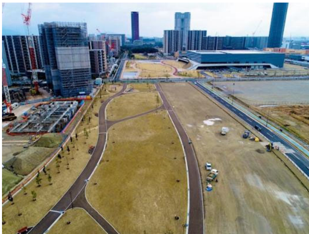
上側が中央公園、下側がはばたき公園