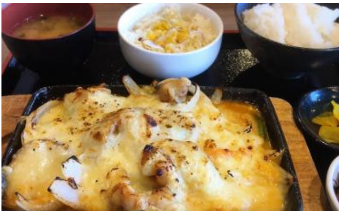
贅沢にチーズあふれるチーズタッカルビ定食&あつあつを頬張りたい焼きカレー（880円税込）。どちらも大ボリュームでした。

掘りごたつ席では、湯あがりの館内着の人もそうでない人も、思い思いにくつろいだようすで食事を楽しんでいました。