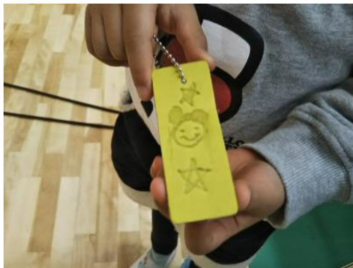
かわいいキーホルダーが完成！

グローブの残革を使ったキーホルダーづくり。 はんだごてを使って絵を画き、自分だけのオリジナルキーホルダーが作れます。