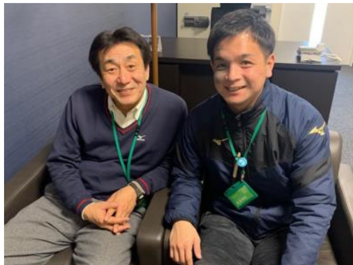
いつもやさしいスタッフの皆さんが迎えてくれます