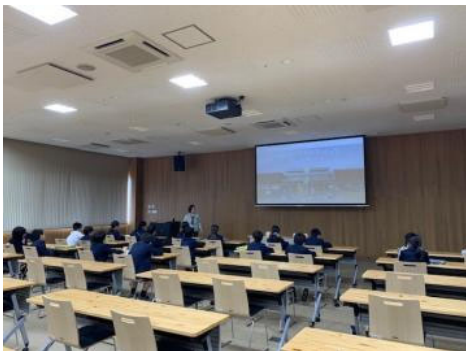
説明も真剣に聞いています

まず、アイランドシティについての簡単に学んだあと、アイランドシティ中央公園の体験学習施設ぐりんぐりんや普段は入ることができないアイランドシティコンテナターミナル、ベジフルスタジアムを見学しました。