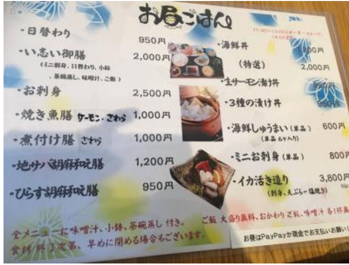
煮つけに焼き魚、鮮魚刺しに海鮮丼、魚づくしで迷ってしまうランチにはすべて、小鉢の他に、魚の出汁の香りと味がふんわり漂う、美味しい茶碗蒸しとお味噌汁がついています。

カウンターには、タラの白子やあんこう、サザエやアワビ、釣りあじ造り、メバル煮つけ……胸躍る品書きがずらりと並び、石井さんの鮮魚に対するこだわりが感じられます。