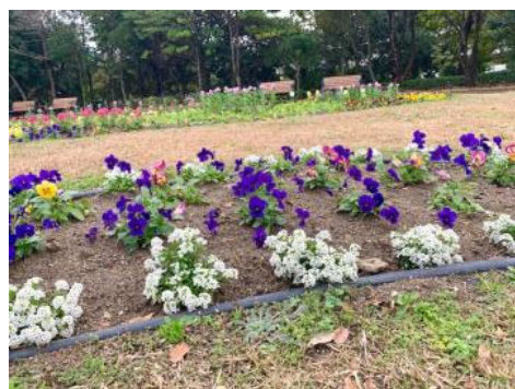
冬でもかわいいお花

アイランドシティ中央公園にはきれいな花が見られるスポットがあります！こども病院側から入った場所にある、グリーンナリー花壇です。