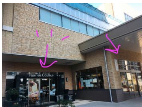
右が照葉スパリゾートの入り口。向かって左です。