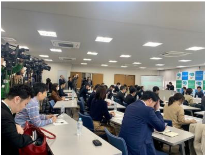
たくさんの記者の方とテレビカメラ、注目度の高さが窺えます