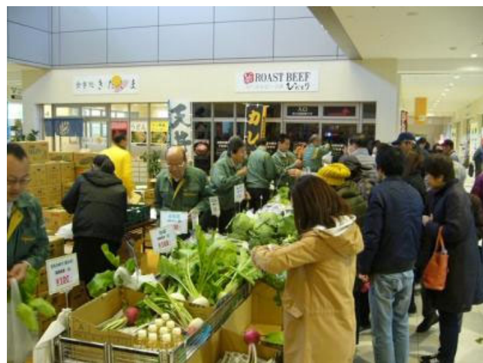
ベジフル感謝祭は毎回多くの来場者で賑わいます！