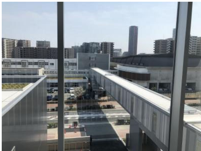
照葉北小学校の中からみた連絡通路