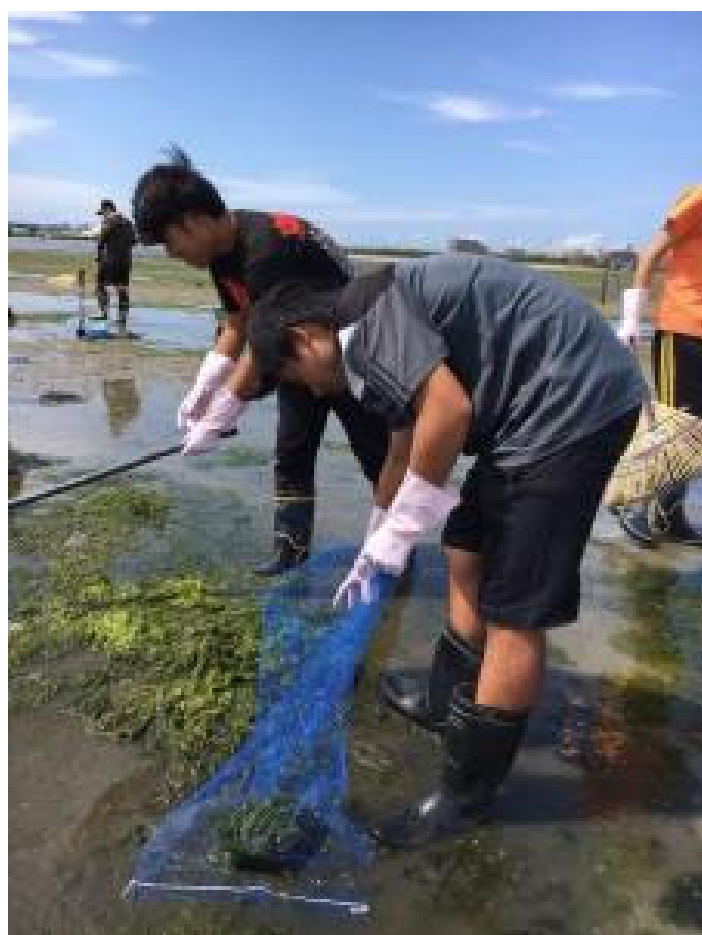
和白干潟の海藻アオサを堆肥に使っています