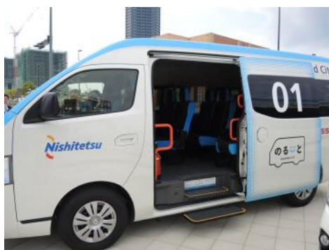
乗客定員 8 名の小型バスです