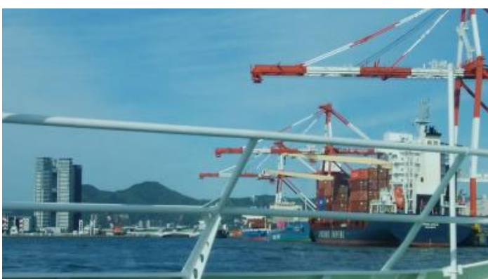
再び手すり越しの…