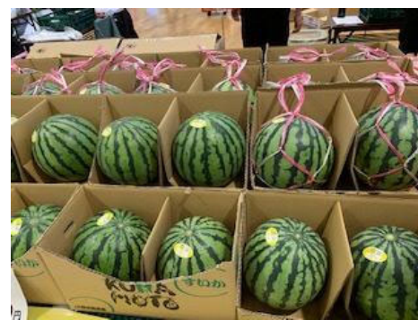
これからの季節、スイカも！

らっきょうを漬けるデモンストレーションのイベントもあっていました。 簡単にらっきょう漬けを作ることができる、便利な商品の紹介がありました！