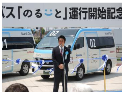
高島市長も出席しました。