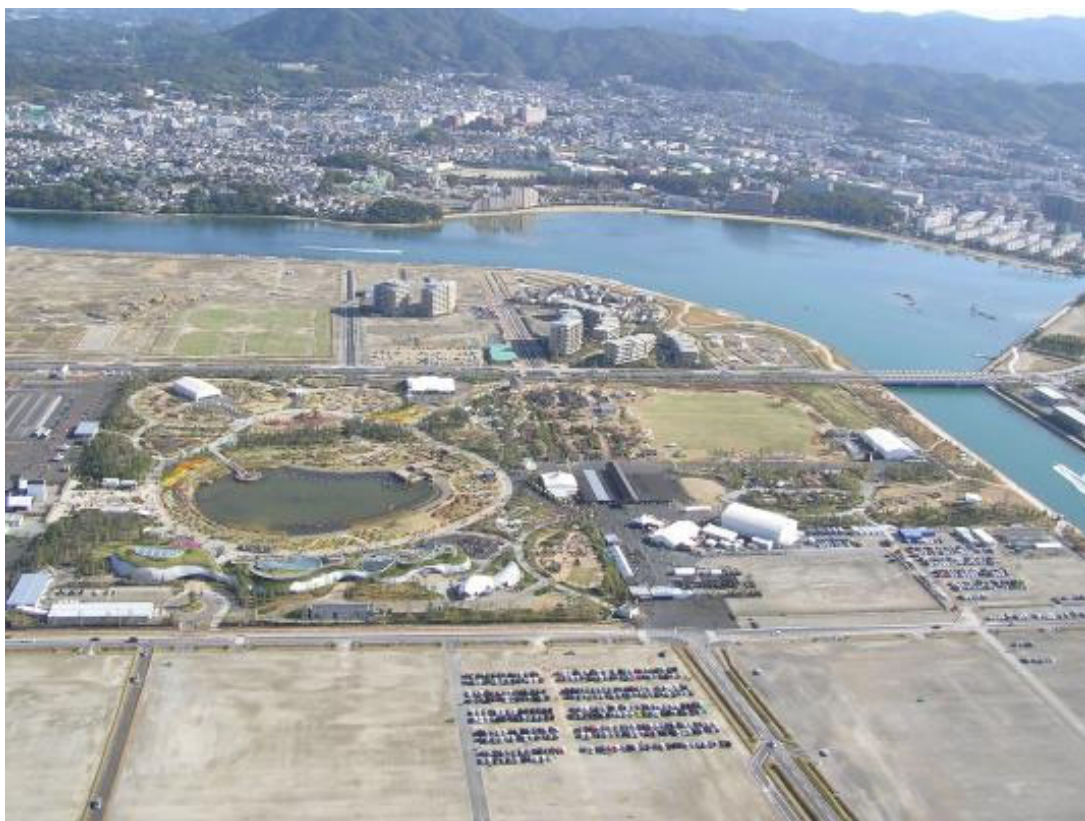
「アイランド花どんたく」とまちびらき間近の「照葉のまち」（2005年11月）