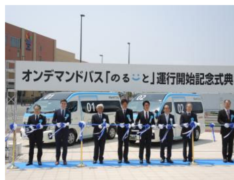
運行開始を記念してテープカット

「のるーと」はアイランドシティ地区、イオンモール香椎浜、千早駅を乗客のリクエストに応じて効率的なルートを選びながら運行する新しいサービスです。 お住いの方、働かれています方、遊びに来られた方など、どなたでも利用できます。 ぜひご活用ください！