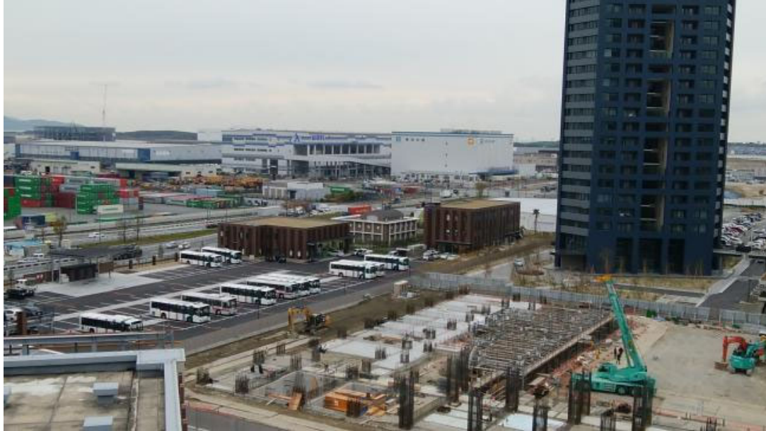
こども病院屋上から

今後、路線バス専用ロータリーの整備が予定されており、さらに都市高速が完成すれば、利便性がより一層向上するのではないのでしょうか。