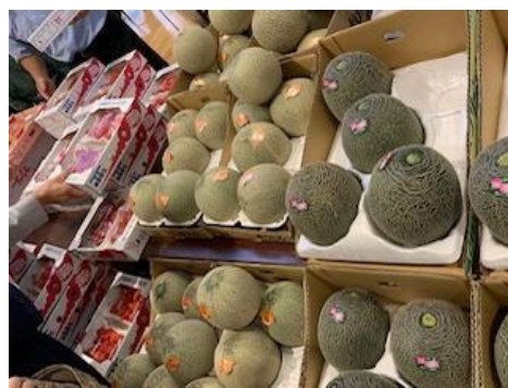
あまおうはなんと2パックで500円