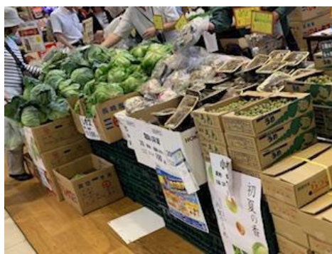
葉物野菜がとってもお得でした。