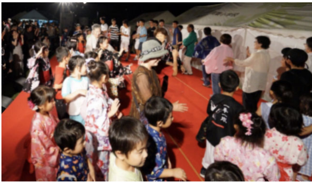
夏祭りでの盆踊りの様子