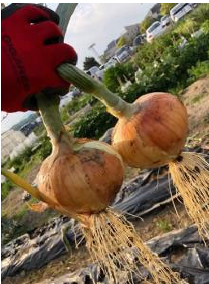
アイランドシティ産たまねぎ