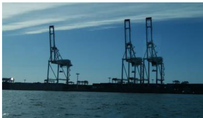
港のキリンがある場所といえば…