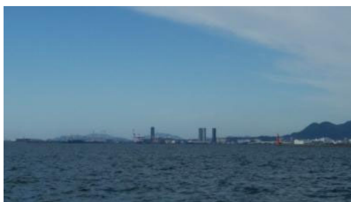
最後に遠くからの…