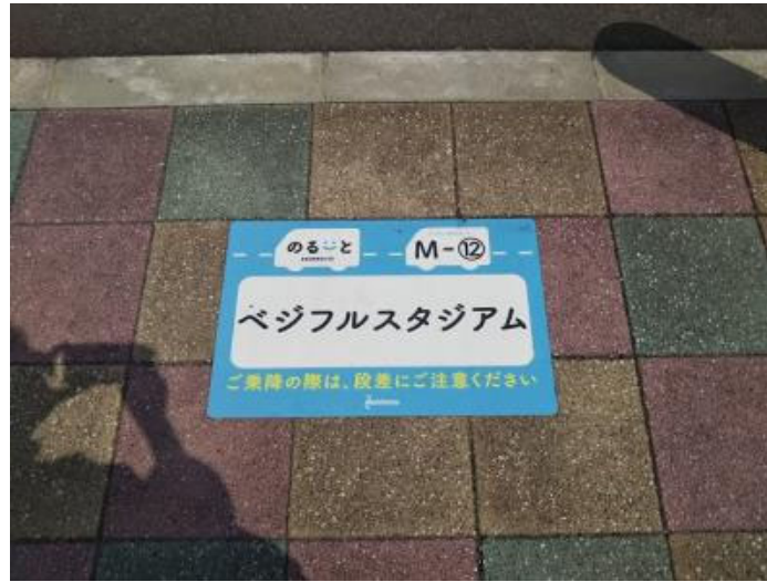
ミーティングポイント

今回はアイランドシティ東側の住宅地を目指します。アプリを起動し、今回は行先を「地図から検索」で選んでみます。行きたい場所にカーソルを運んで決定すると、運賃、降車場所への到着見込みなどが表示されます。配車を確定すると予約完了です。あとは待つのみ！