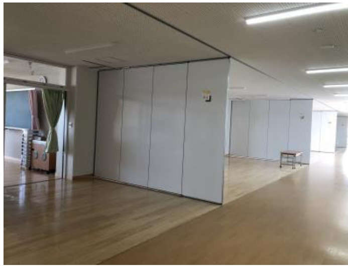
間仕切りした様子