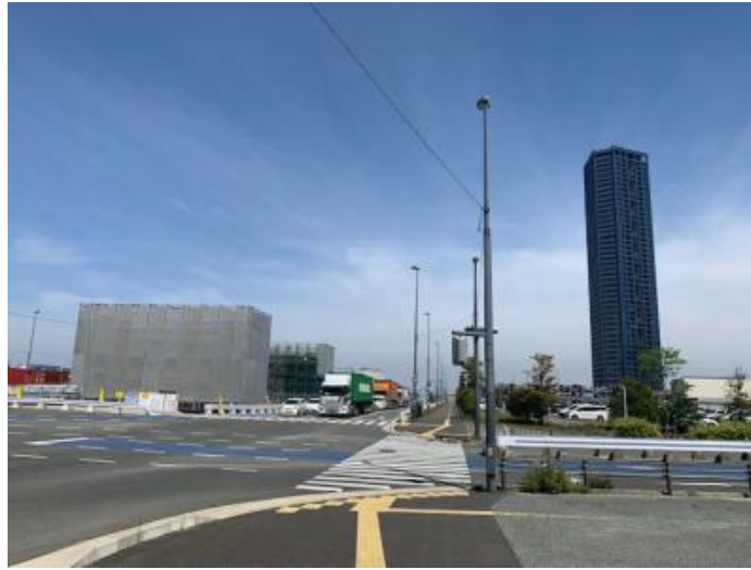
こども病院の方まで工事の橋脚が！