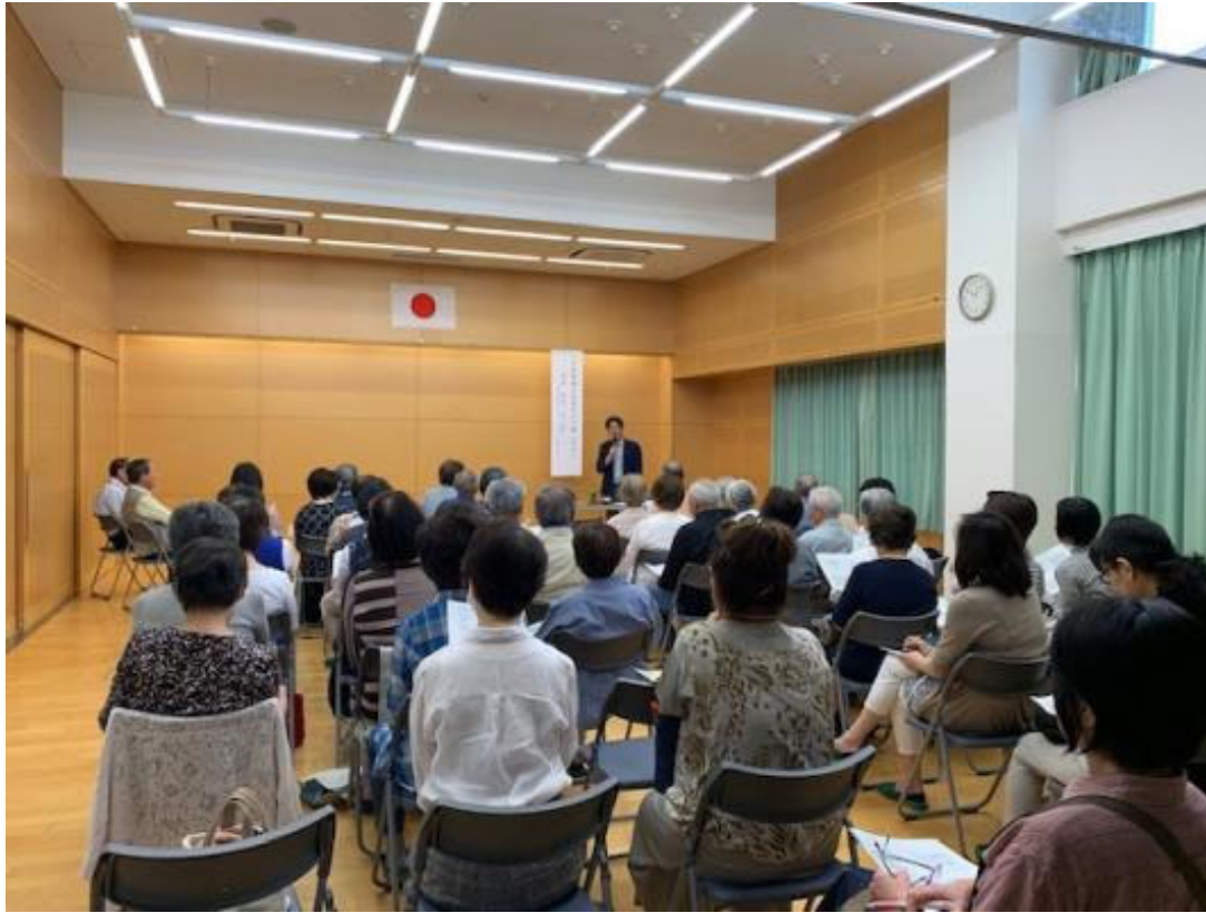
会場の様子、みなさん真剣に聴き入っておられました！

普段の生活で真剣に考える機会が少なかった方でも、今回のCafe Terihaが今後の医療について考えるよいきっかけになったのではないのでしょうか。