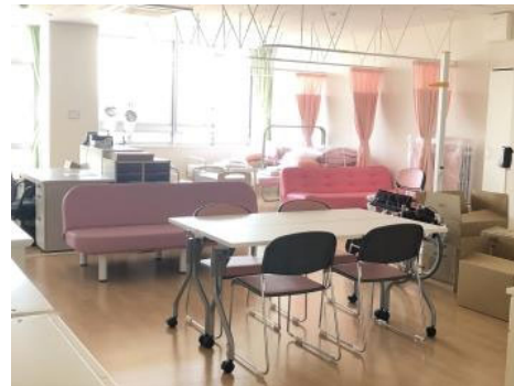
保健室。ピンクは心が落ち着く色なんだそうです。