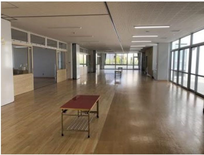
写真の左側が教室