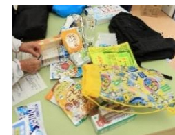
▲非常用持ち出し袋には貴重品や医薬品、携帯電話、モバイルバッテリーなどを入れるよう