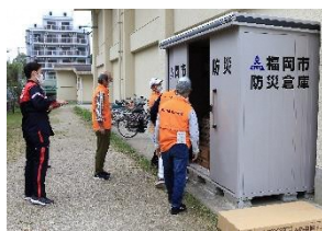
▲避難者用テントや段ボール仕切り、ブルーシート、ベンリーテントなどは片江小学校の福岡市防災倉庫にあります。