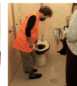
▲便座と便器の間に袋を挟み、そのまま使用。後は凝固剤で固め、おむつ同様ゴミ袋へ