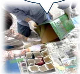
↑型に流し込む作業

令和5年10月7日(土) 片江公民館(駐車場)にて、片江セミナーが行われました。今回は、公民館と共催で「大人の物づくり～廃油石鹸作り～」というテーマで行い、男女共同参画委員を含む約15名が参加しました。