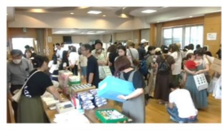
参加団体：自治協ステージ景品販売・片江3丁目・片江4丁目・体育部・片江おやじの会 てづくり友の会・ジュニアサポーター・おとなりさん南片江