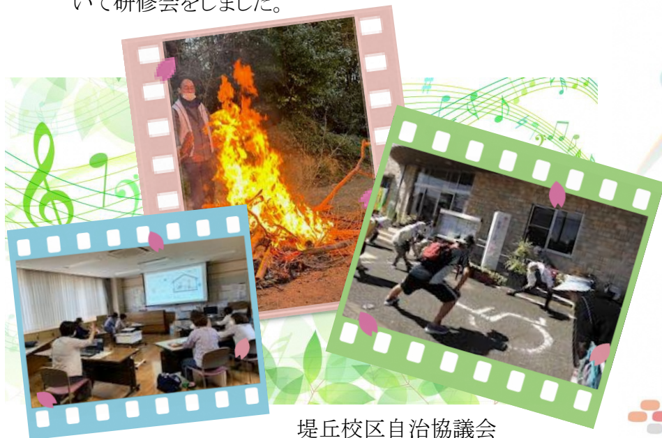
堤丘校区自治協議会