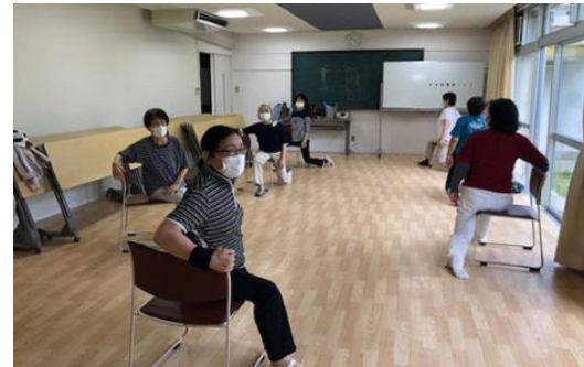
←ここに体操での様子

堤丘校区の皆様が住み慣れた地域で、いつまでも元気で過ごせるようお手伝いができるとうれしいです。