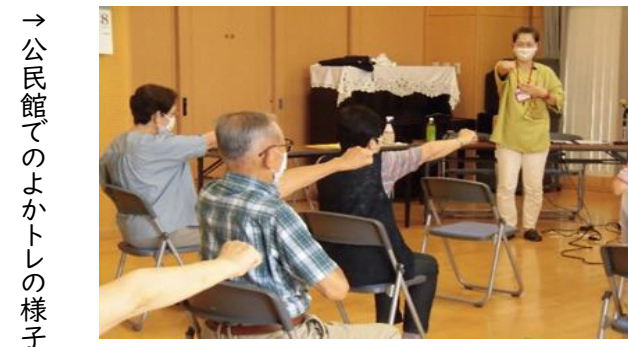
→公民館でのよかトレの様子