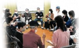
樋井川1丁目サロン 「さくらの会」