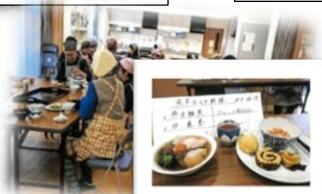
食生活推進員協議会