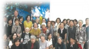
堤1丁目サロン 「遊友くらぶ」