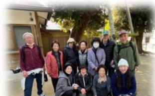
さわやかウォーキングの会