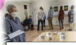
堤団地サロン 「にこにこサロン」