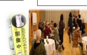
カフェつつみがおか