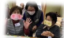
樋井川2丁目サロン 「ホット」