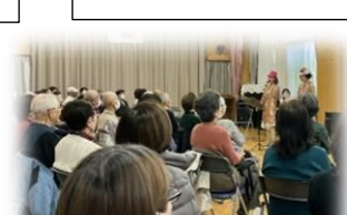
いきいきスポット