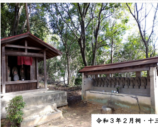
令和3年2月祠・十三仏・境内の写真