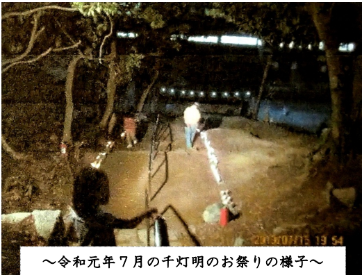
～令和元年7月の千灯明のお祭りの様子～