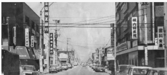
上は写真①「昭和40年代後半」下は現在

写真1枚で懐かしい思いや記憶がよみがえりますね。「ここぞという場面や記念」に撮影することが多かっただけに、手元に届くまでの待ち遠しさまで思い出されます。