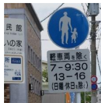
時間帯通行止めの例 【鳥飼公民館前交差点】