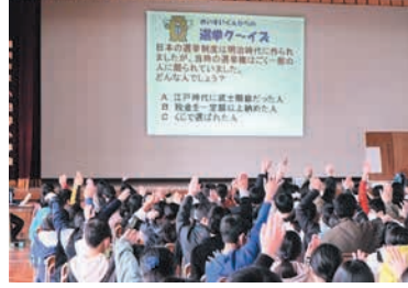
選挙について学びます