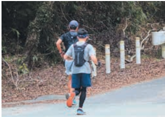
山道に挑む選手たち(昨年)

その一環として3月12日(日)、第3回五ヶ山・脊振クロストレイルが開催されます。アウトドア施設「五ヶ山クロススペース」を拠点に、五ヶ山ダム周辺の脊振山系の自然豊かな約32キロのコースを約300人の参加者が駆け抜けます。