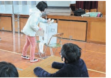
立会人席で投票を確認します