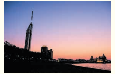
夕焼けに染まる福岡タワー

開 = 日時 所 = 場所 問 = 問い合わせ ☎ = 電話 ㊟ = ファクス 対 = 対象 定 = 定員 料 = 料金、費用 持 = 持参 託 = 託児 申 = 申し込み 電 = メール 開 = 開館時間 休 = 休館日