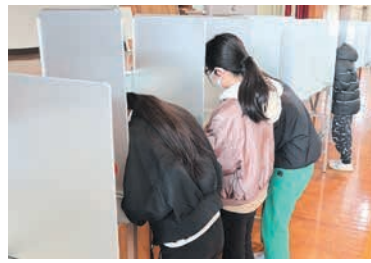
候補者名を記入中