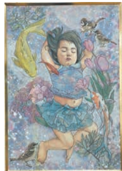
①「Don't wake the baby」

「博多区文化・芸術展」に過去最多の214点の作品が寄せられ、その中から入賞作品59点が決定しました。各部門の受賞者の皆さんを紹介します。す=下表。掲載作品①～⑥は会長賞受賞作品です。