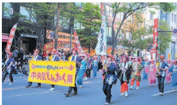
総勢約100人の「中央区どんたく隊」が明治通りを練り歩きます

※新型コロナウイルス感染症の影響により、パレードを中止もしくは内容を変更する場合があります。またワクチンの接種歴が参加条件となる場合があります。