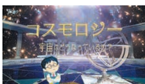
コスモロジー 宇宙はどうなっているの?

宇宙観の変遷や、現在分かっている宇宙の姿について紹介します。小学生以上推奨。開3月15日(水)～6月5日(月) 休各回220人(先着) 休大人510円、高校生310円、小中学生200円、未就学児無料 休当日午前9時半から同館3階チケットカウンターで販売。