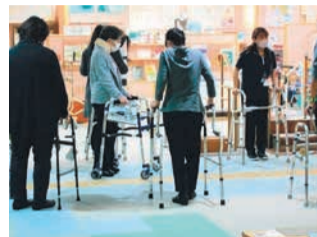
⑦歩行を助ける用具と靴選び