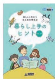
「暮らし上手のヒント」の表紙

今号の内容は▷食品の保存方法▷住まいのカビ対策一など。情報プラザ(市役所1階)、各区衛生課などで配布。☎食品安全推進課 ☎711-4277 ☎733-5588