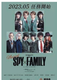
「スパイファミリー」のポスター