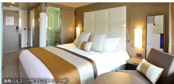
海側バルコニー付 プレステージ(一例)