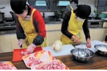
大きなダイコンは、葉までカレーに使います

昨年12月21日には14人のスタッフと高校生のボランティアらが、近所の人や久留米の農家から提供されたダイコンやブロッコリー、ホウレン草を使い、カレーとホウレン草のお浸し、カップケーキを作りました。