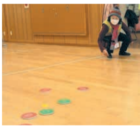
ポイントに狙いを定めて投げます

飯原公民館で、高齢者サロン「わくわくサロン」と校区健康づくり推進委員会の共催でカーリンコン大会が開催されました。近年新しく考案されたニュースポーツは、年齢や体力にかかわらず、誰もが気軽に楽しめるのが特徴です。その一つのカーリンコンは、表裏が赤色と緑色のディスクを2チームが交互に投げ、ポイントに近いディスクがどちらのチームの色かで勝敗が決まります。裏