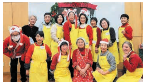
最年長のスタッフは84歳。笑顔で迎えます

飯原公民館で、高齢者サロン「わくわくサロン」と校区健康づくり推進委員会の共催でカーリンコン大会が開催されました。近年新しく考案されたニュースポーツは、年齢や体力にかかわらず、誰もが気軽に楽しめるのが特徴です。その一つのカーリンコンは、表裏が赤色と緑色のディスクを2チームが交互に投げ、ポイントに近いディスクがどちらのチームの色かで勝敗が決まります。裏