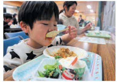
おいしそうにカレーを食べる子ども

● 始めたきっかけ おとしの5月、コロナで学校が休みになったとき、保護者が家にいないなどの理由で、遅い時間まで公園にいる子どもたちの姿をよく見かけました。また、家で一人で