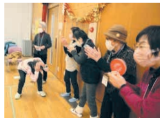
ディスクの行く先に一喜一憂する参加者

この日は、60歳代から80歳代後半までのサロンの参加者や健康づくり推進委員会のメンバーなど、8チーム24人がゲームに臨みました。今回が2回目という参加者は、「前回来た時にカーリンコンに初めて挑戦しましたが、ルールが簡単ですが、楽しめました。今日も頑張ります」