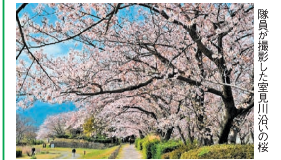
隊員が撮影した室見川沿いの桜