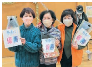
表彰式で笑顔の優勝チーム

と笑顔で話しました。ゲームが始まると、ディスクを投げる選手を両チームが見守り、ディスクがポイントの近くでピタッと止まると手をたたいて喜びます。逆にコートの外まで飛んでいくため息が聞こえます。試合の終盤に、ポイントをはじめ動かし逆転する場面もあり、終始にぎやかにゲームを楽しみました。