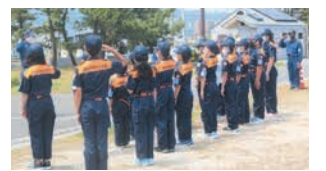
長垂海岸で規律訓練

区内には3つの消防少年団があります。年間を通して体育大会や楽しい防災教育と街の清掃などの社会奉仕を行います。たくさんの友達と一緒に心に残る思い出作りをしませんか。