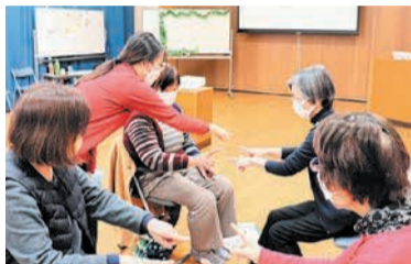
中国の留学生からも手あそびを習いました

日本との暮らしの違いについては「バイクでの移動が主流のベトナムに比べて、日本は電車やバスなどの公共交通機関が豊富で移動しやすいこと」などを話しました。また、「手あそびをして盛り上がりました。楽しんでもらえてよかったです」と喜んでいました。