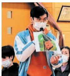
自国の料理を紹介する留学生

区は、今後も外国人居住者と地域住民が、交流を通じてお互いの違いを理解し合い、誰もが住みやすいまちになるよう、気軽に参加できるイベントを行っています。公民館での交流の情報は、公民館だよりで確認するか、区ホームページ(公民館だより)で検索)でご確認ください。