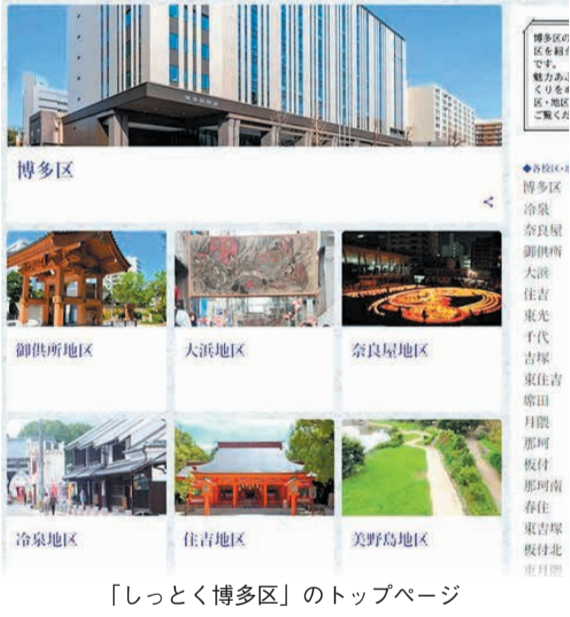
「しっとく博多区」のトップページ