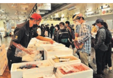
多くの人でにぎわう市民感謝デー(昨年)

市鮮魚市場内の市場会館には、市場関係者の事務所他、魚料理を提供する飲食店など、一般の人でも利用できる施設があります。2階には、魚について楽しく学べる「魚っちんぐプラザ」や午前3時に始まる「競り」を見学できる「自由見学