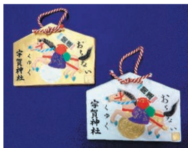
馬人形をあしらった絵馬。「落ちない馬」として受験生に好評

今年は新たに、博多人形の技法を用いて、宇賀神社(大宮二丁目)の絵馬を造形・彩色し、地域の人々に博多人形の魅力を伝えていきます。