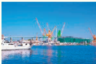
かもめ広場からの眺め (港二丁目)

〒810-8622 中央区大名二丁目5-31 区役所代表電話 ☎714-2131