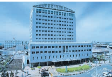
博多湾を一望できる市場会館

練習中の小学生は、「装束を着て演じる発表会が楽しみです」と目を輝かせて話していました。☎草ヶ江公民館 ☎741-7998 ☎741-5812