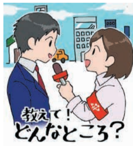
教えて! どんどころ?

玄界灘、吉岐、対馬などの近海や西日本各地の漁場で取れた魚介類が集まる全国有数の市場で、「魚のおいしい街・福岡」を支えています。