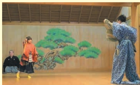
能舞台上で演目「いろは」を発表しています

狂言は、室町時代から約650年続く日本を代表する伝統芸能で、庶民の生活を明るく描いたせりふが中心の喜劇です。