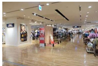
<会場>※当日はテーブルを設置