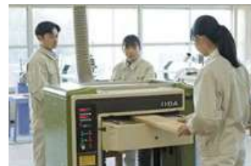
<博多工業高校 実習の様子>