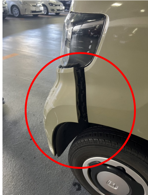
接触に伴うバンパーの破損