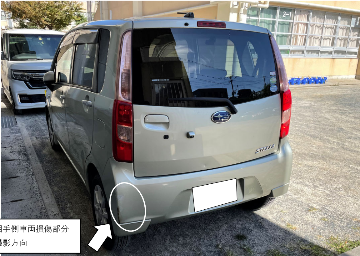
相手側車両損傷部分 撮影方向