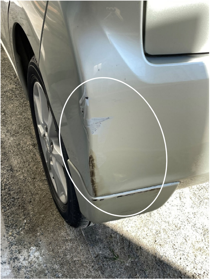
左リヤバンパーの損傷