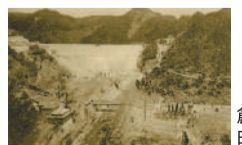
創設当時の曲淵ダム