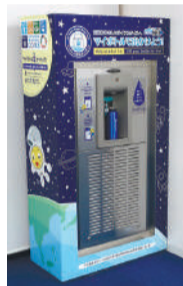
マイボトル用給水スポットの設置