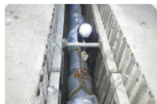
耐震管への計画的な取替え

近年、気候変動に伴う災害が激甚化・頻発化する中、災害時でも水道水を安定して提供できるよう、浄水・配水施設の耐震化を全て完了しました。今後とも老朽化の状況などに応じて、配水管の耐震管への取替えや、水道施設の耐水化を進めていきます。