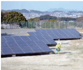
浄水場に設置している太陽光発電パネル

再生可能エネルギー由来電力の調達や電気自動車等の導入拡大、給水スポット設置など、多様なアプローチで、福岡市が目指す2040年度ゼロカーボンシティの実現に取り組んでいきます。