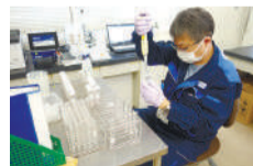
水道水質センターでの水質検査

水道水をそのまま飲める国は日本を含め世界で約10か国。福岡市では、国が定める水質基準51項目の検査に加えて、より高品質の水道水を目指すための検査を独自に150項目以上行い、水道水の安全性やおいしさの向上を図り、お客さまの満足度を高める取組みを進めています。