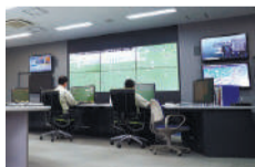
水管理センター(水道局庁舎内)の「配水調整システム」

現在のSDGsの理念にもつながる「節水型都市づくり」を進め、配水管の流量や水圧をコントロールする「配水調整システム」等によって水の有効利用を図ることで、世界トップの低い漏水率となっています。今後も、IoTセンサを活用した漏水調査など、更なる水の有効利用に向けた取組みにも挑戦していきます。