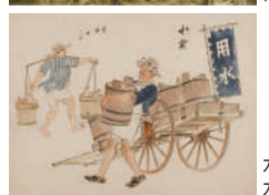
水道創設前の水売りの様子