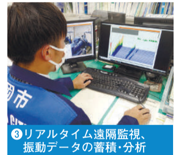
3 リアルタイム遠隔監視、振動データの蓄積・分析