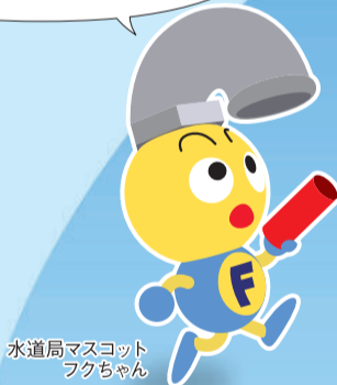
水道局マスコットフクちゃん

新たな取組みにチャレンジしながら、次の世代に持続可能な水道事業をつないでいきます！