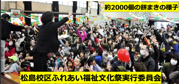
約2000個の餅まきの様子

12月4日（日）に3年ぶりとなる「ふれあい福祉文化祭」が開催されました。「公民館サークル成果発表」、「餅つき・餅まき」、「お楽しみ抽選会」など、多くの方の参加頂き、大変盛り上がりしました。ご協力頂いた皆様にお礼申し上げます。