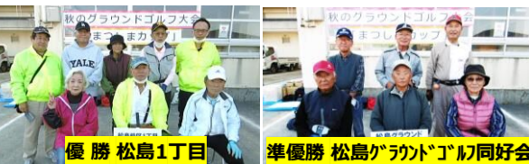
優勝 松島1丁目 準優勝 松島グラウンドゴルフ同好会