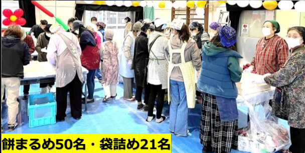
餅まるめ50名・袋詰め21名

餅つき手35名 <つき手協力団体> 順不同 ・笑心笑心運動教室 ・Mariジュニアバレエ ・エストライフ ・クラブハウ ・松島ジュニアダンス ・フューチャー&ドリム ・テコンドークラブ ・松島サッカークラブ ・松島エンジェルズ ・原田東2区自治会 ・米一丸二丁目自治会 ・新連町自治会 ・ルザーラ ・その他の皆様 「お疲れ様でした。」