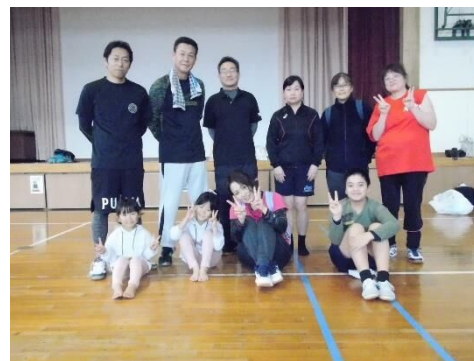
ビーチボールバレー混成 A 優勝 本町