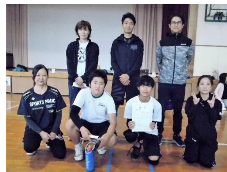
ファミリーバドミントン 優勝 田新町