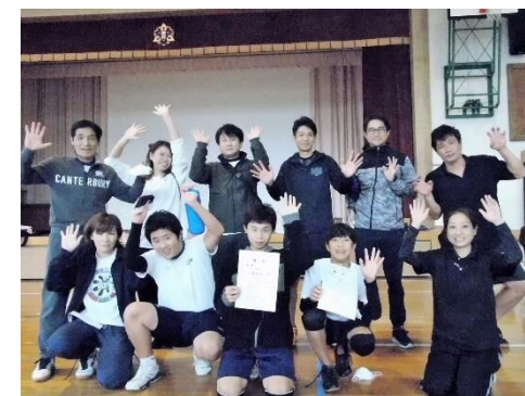
ビーチボールバレー混成 B 優勝 田新町