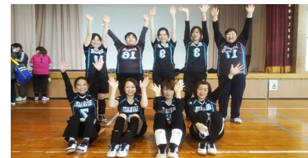
ママさんバレー秋季大会 優勝 田新町町内会