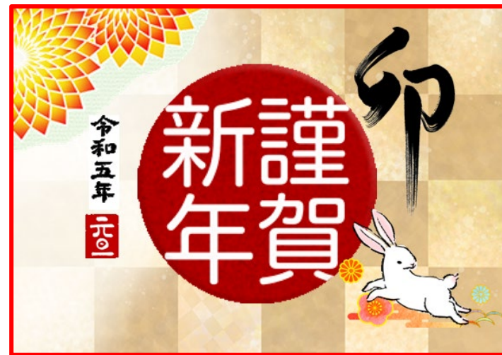
(パソコンサークルの作品です)