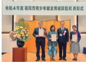
表彰式に参加した区内受賞者の皆さんと区長

青少年健全育成と非行防止に取り組み、貢献している個人・団体に贈られます。区では、以下の5人が受賞しました(50音順・敬称略)。