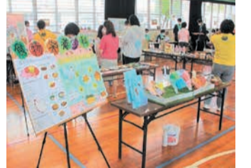
カラフルなイラストで健康に配慮した食生活を解説

「共創」で取り組む健康づくり 筑紫丘校区健康推進部と筑紫丘公民館は、純真学園大学・純真短期大学と合同で「健康フェスティバル2022」を実施しました。同大学・短大の各学科が、血圧、脈拍、体組成、骨密度等の測定や、食事の栄養バランスに関する展示など、