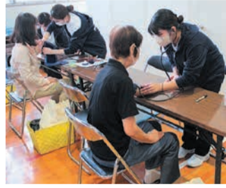
和やかな雰囲気です。血圧を測定

それぞれの専門性を生かしたコーナーを設け、参加者の健康チェックや健康づくりに関するアドバイスを行いました。