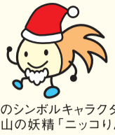
区のシンボルキャラクター 油山の妖精「ニコリん」

〒814-0192 城南区鳥飼六丁目1-1 窓口受付時間：午前8時45分～午後5時15分 （土日・祝休日・年末年始を除く） 区ホームページは「福岡市城南区」で検索