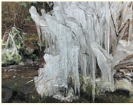
噴水つらら（油山市民の森）