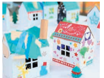
家型の段ボールに色紙で飾り付けをしています

ワークショップ「サンタクローズのまちをつくろう」で制作した、家やまちを展示します。クリスマスツリーが飾られ、クリスマスの雰囲気を感じられます。