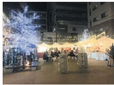
鮮やかに光り輝く会場

飲食スペースや物販コーナーを設け、クリスマスにちなんだ食べ物やハンドメイド雑貨等を販売します。