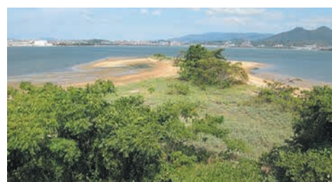
現在は長さ約230m、最大幅約90mあります

砂嘴とは、潮の流れによって、海岸の岬の先端などに堆積した土砂が鳥のくちばしのような形で海に突き出した地形のことです。その砂嘴が対岸や付近まで伸びた地形を砂州と呼びます。海の中道は、志賀島と本土を繋ぐ陸繋砂州で長さ約10km、最大幅約2kmの巨大な砂州です。先端は満潮時でも通行できるように、志賀島と橋で結ばれています。