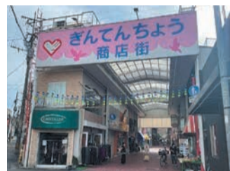
屋根がついているので、雨にぬれずに買い物できます