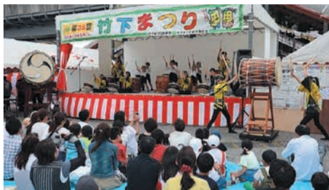
竹下太鼓の力強い演奏 (2019年)

☎ = 日時、開催日、期間 所 = 場所 問 = 問い合わせ ☎ = 電話 ㊟ = ファクス 図 = 対象 定 = 定員 料 = 料金、費用 託 = 託児 申 = 申し込み 持 = 持参 電 = メール 頁 = ホームページ