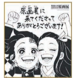
入場時に「吾峠呼世晴描きおろし・特製ミニ色紙」を差し上げます(チケットまたは招待券1枚につき1点)

「鬼滅の刃」は、「週刊少年ジャンプ」に2016年2月から4年3カ月にわたり連載されました。コミックス全23巻は累計発行部数1億5千万部(電子版含む)を突破、2020年10月公開の映画「劇場版『鬼滅の刃』無