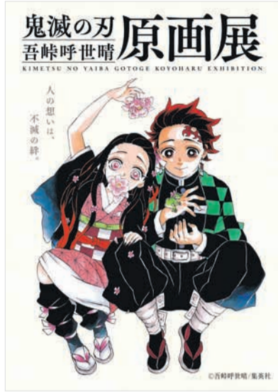
本展キービジュアル

15日(日)▽後期 11月17日(火)～2月19日(日) 開午前9時半～午後5時半(入場は4時半まで) 市博物館2階特別展示室(早良区百道浜三丁目) ☎845・5011