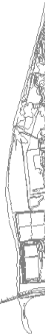
アイランドシティはばたき公園